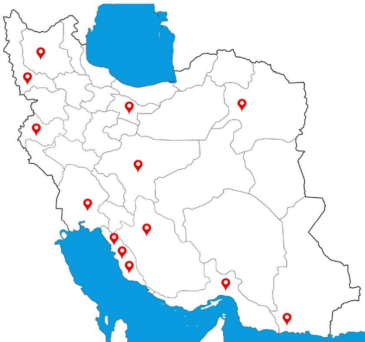
↑ شعب و نمایندگی‌های داخلی