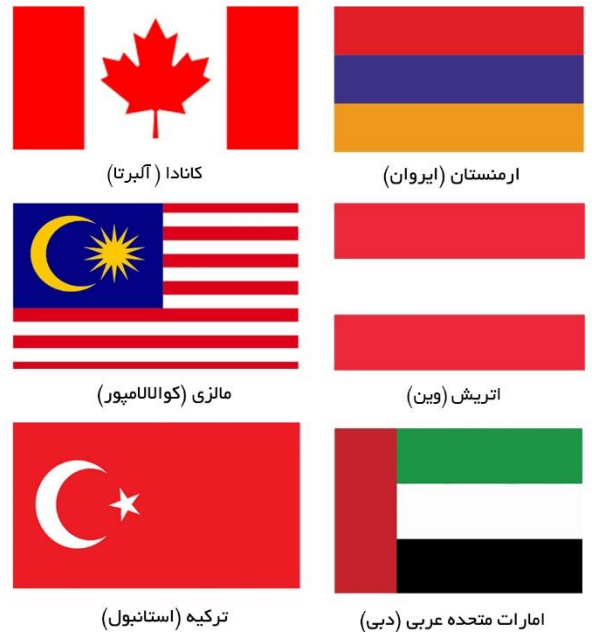
↑ شعب خارجی